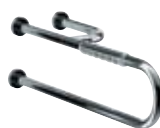
5785 262 61 Stütz-Griff, 600 mm Support bar