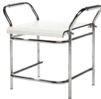
5751 262 00 / 01 Aufstehhilfe (mit abnehmbarer und seitlich einzuhängender HPL-Sitzfläche) / Aufstehhilfe ohne Sitzfläche Supporting seat (with removeable and attachable seat from HPL) / Supporting seat without seat