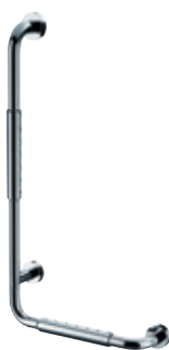
5770 262 61 Winkelgriff, rechts Angle grip, right