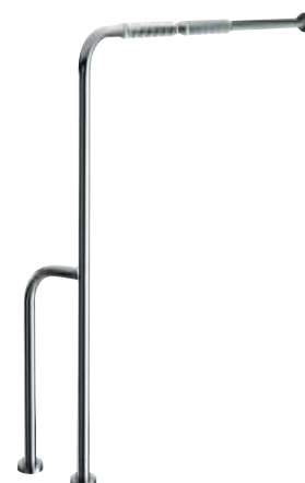
5785 262 86 Boden-Wand--Stützgriff Floor-wall-support bar