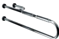
5785 262 85 Stütz-Griff, 850 mm Support bar