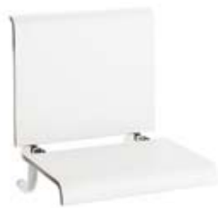
5751 215 01 / 03 Einhängesitz mit HPL-Sitzfläche / mit Kunststoffsitzfläche (nur in Verbindung mit 5751 001 00/01/02) Folding seat, with seat from HPL / with seat from plastic (only available with 5751 001 00/01/02)