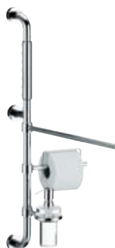
5782 001 00 / 01* / 02** WC-Bidet-Line WC-Bidet-Line