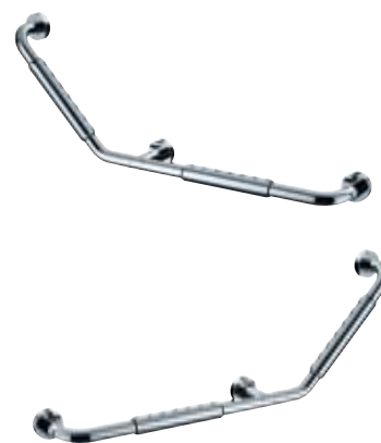
5770 262 70 / 71 Winkelgriff, links/rechts Angle grip, left/right