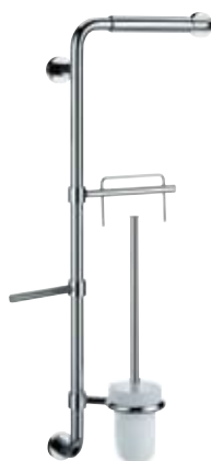
5780 001 01 WC-Line WC-Line